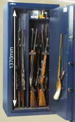
EXEMPLE D'AMENAGEMENT N°2 POUR 14 ARMES

Corps renforcé à double paroi d'une épaisseur totale de 58 mm.