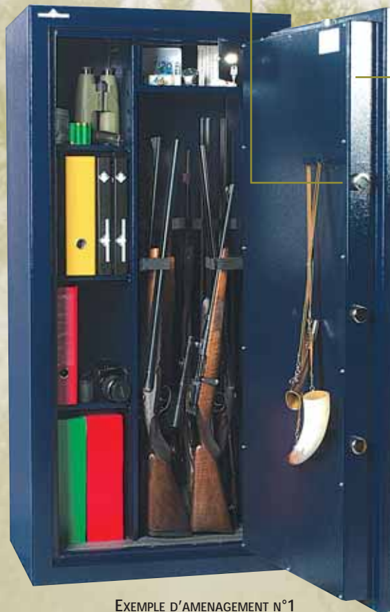
EXEMPLE D'AMENAGEMENT N°1 POUR 10 ARMES