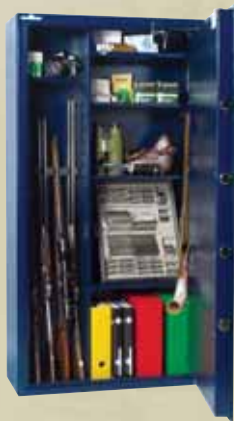
EXEMPLE D'AMENAGEMENT N°3 POUR 5 ARMES