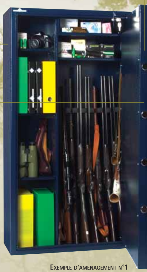
EXEMPLE D'AMENAGEMENT N°1 POUR 9 ARMES