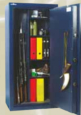
EXEMPLE D'AMENAGEMENT N°3 POUR 4 ARMES