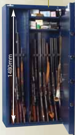
EXEMPLE D'AMENAGEMENT N°2 POUR 14 ARMES